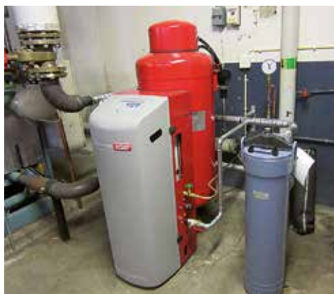
Undercentralen på Gussarvsgården har fått avgasare och filter.

Värmesystemen behöver beräknas och justeras så att alla lägenheter får lika mycket värme. Det samlas mycket smuts och vi installerar därför filter och avgasare för att förlänga livslängden på pumpar och ventiler. De senaste områdena där vi har justerat värmesystemen är kvarteren Eken, Skäppan och Norelund.